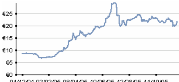
Vývoj ceny - forward s dodáním k 1.12.2006

Pozornost obchodníků se začala soustřeďovat na spotové obchody a forwardy s dodáním v příštím roce. Nárůst spotových obchodů se očekává zejména kvůli povinnostem podniků do 30.4.2006 vyřadit povolenky odpovídající emisím za rok 2005, podle kterých budou podniky upravovat počet držených v povolenek.